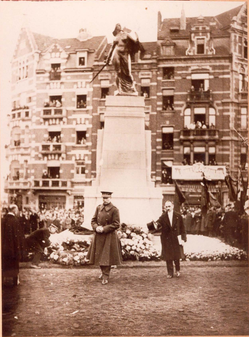
Inauguration du Monument aux Héros Iackenois. le 11.11.1926.