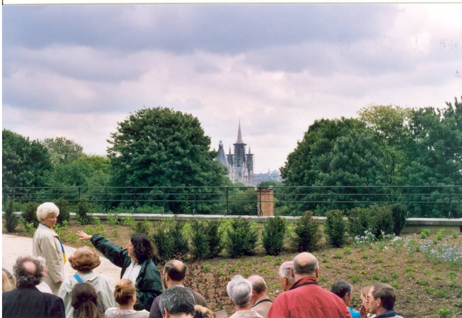
Een sfeerbeeld van de opendeurdag op 17 mei 2003

aan hun wandeling door de diverse op elkaar aansluitende parken een toegevoegde waarde te hechten.