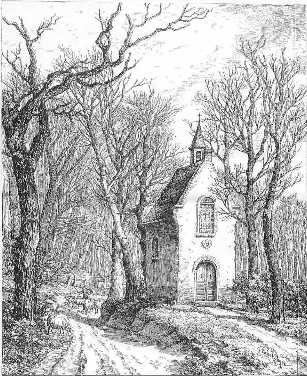
Gravure 1: St-Annakapel uit "De Vlaamsche Illustratie" 4 dec 1886