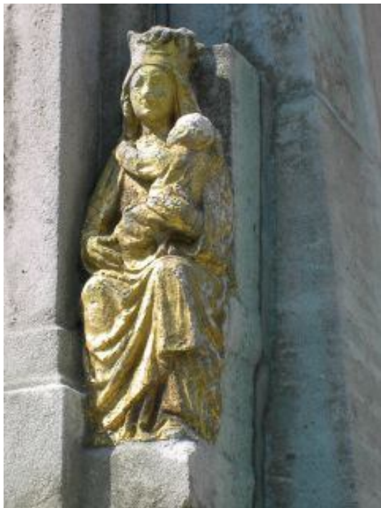
Detail sokkel monument Sedes Sapientiae

LACA juicht met dankbaar genoeg het initiatief van Schepen Simons toe!